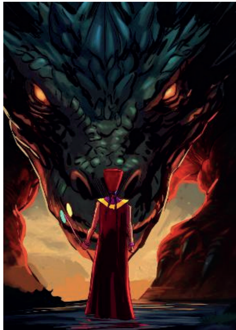
Beasts of Tazeti

The CANIMAF 2024 Creation Residency offers an exceptional opportunity for Cameroonian creators to bring their ideas to life and start the development phase of their animation projects. We invite all promising talents to seize this unique chance to work in the ZEBRA Comics studios, learn from the best, and contribute to the growth of African animation.